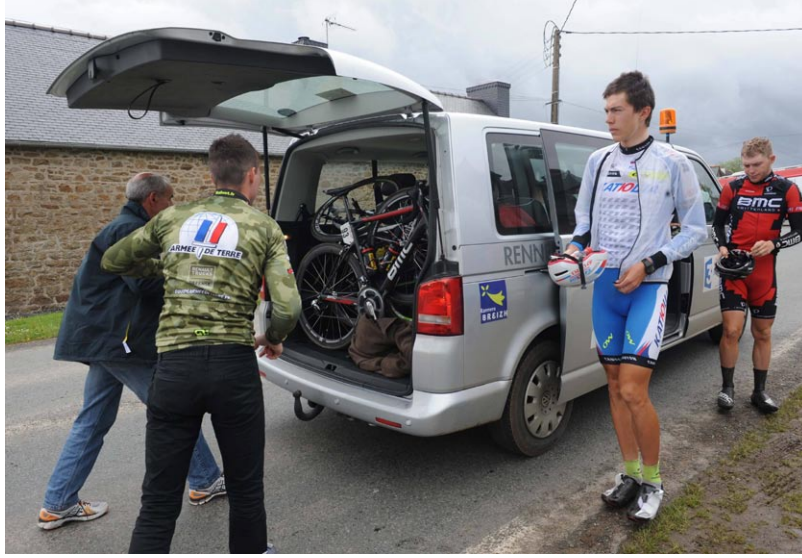
Conséquence des nombreux abandons, les coureurs sont obligés de descendre de la voiture balai au ravitaillement faute de place.