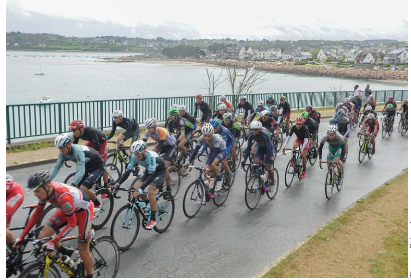
L'arrivée des coureurs à Perros-Guirec, hier en fin d'après-midi, sous un temps menaçant.